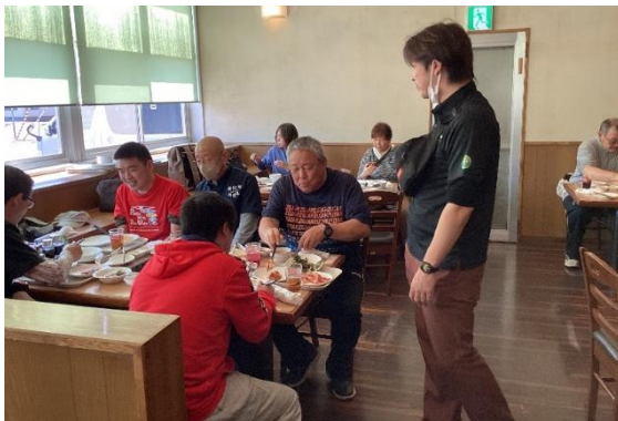
ウエスタンにて美味しい昼食を！！